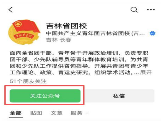
①微信公众号搜索“吉林省团校”