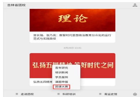
④点击团课大赛进行上报