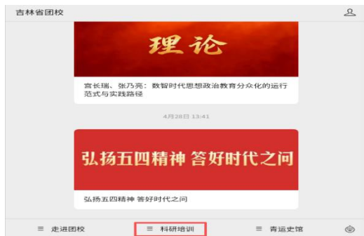
③进入“吉林省团校”公众号后点击科研培训